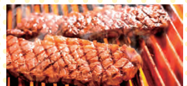
ダイナーステーキコース (イメージ)