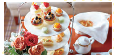
アフタヌーンティー (イメージ)