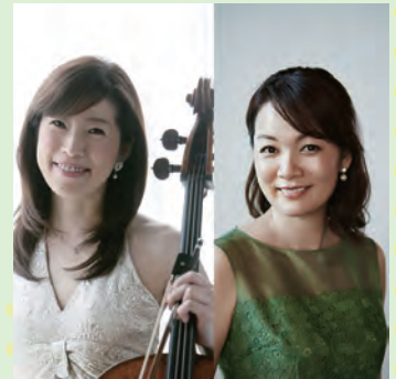
長谷川陽子