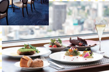
プリフィックスランチ (イメージ)