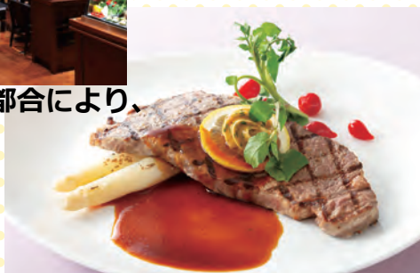
ステーキセット (イメージ)