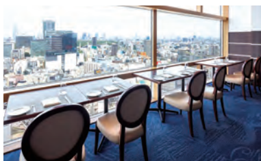
渋谷を一望できる窓側席