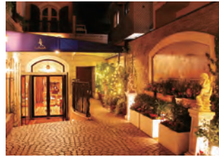
南青山エントランス