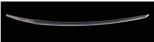
重要文化財 太刀 銘口忠 (名物膝丸・薄緑) 一口 鎌倉時代 13世紀 京都・大覚寺

本展では、匠の技により鍛え磨かれた刀剣を一堂に集めます。さらに合戦絵巻や物語絵によって武家の暮らしをふりかえり、日本の洗練された武家文化を堪能する貴重な機会となります。