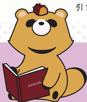
きんぶくオリジナルキャラクター