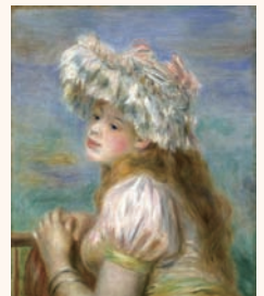
ピエール・オーギュスト・ルノワール《レースの帽子の少女》1891年 油彩/カンヴァス

日本でも屈指の西洋コレクションを誇るポーラ美術館から、特に人気の高いフランスで活躍した作家28名による絵画を精選し、化粧道具コレクションと合わせた総数訳90点の作品を紹介します。