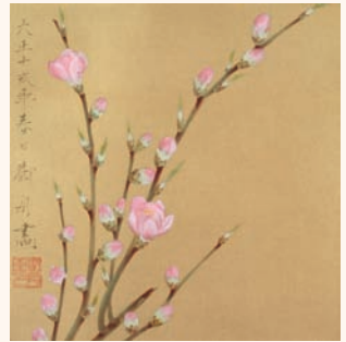
速水御舟《桃花》1923 (大正12)年 紙本金地・彩色 山種美術館

本展では、御舟による卓越した技法の作品として、近年の調査で画面の裏から彩色した事実が判明した《和蘭陀菊図》をはじめ、金砂子を地一面に使う「撒きつづし」を用いた《名樹散椿》【重要文化財】、本人が「二度と出せない」と述べた色で背景を表現した《炎舞》【重要文化財】などを中心に展示します。