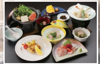
河津さくらの里しづや

補助額 会 員 4,000円 /泊(2泊まで) 登録家族 2,000円 /泊(2泊まで)