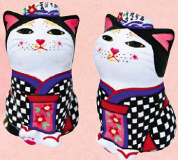
あんこ猫 制作/エサントモコ