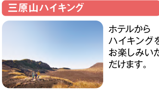
三原山ハイキング