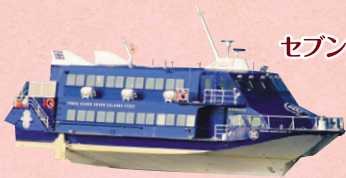
セブンアイランド結