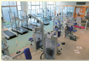
猿楽トレーニングジム