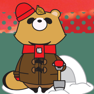
きんぶくオリジナルキャラクター