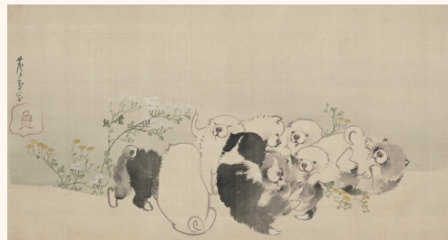
長沢芦雪《菊花子犬図》 18 世紀 (江戸時代) 絹本・彩色 個人蔵

※入館は閉館 30 分前まで ※中学生以下は入場無料 (付添者同伴) ※入館日時のオンライン予約も可能。 ※チケット提示で太田記念美術館、戸栗美術館相互割引も受けられます。