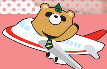
きんぷくオリジナルキャラクター