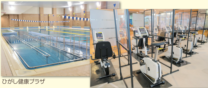
ひがし健康プラザ