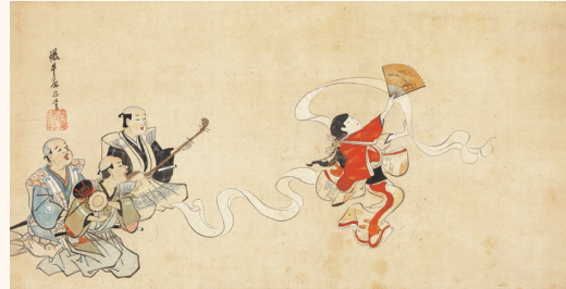
重要文化財 布晒舞図 英一蝶 一幅 江戸時代 17～18世紀 遠山記念館 〔展示期間 10/16～11/10〕