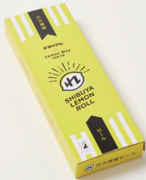
おすすめ商品 渋谷檸檬ロール(レモン味)

場所はMIYASHITA PARK South2F。 渋谷のカルチャーにとことんこだわった渋谷土産のお菓子、食品、雑貨、渋谷生まれのビールやお酒など、渋谷文化人のコラボ限定商品もある楽しいお店です。 自分用にも! 贈り物用としても! 税込400円以上のお会計時に、1人1枚共通補助券が使えます。