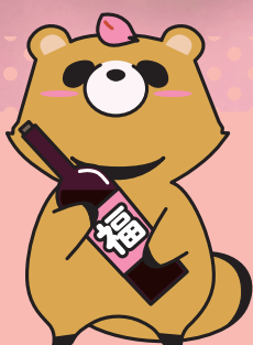
きんぷくオリジナルキャラクター