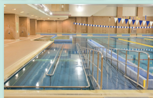
渋谷区スポーツ施設 (ひがし健康プラザ・代官山スポーツプラザ・猿楽トレーニングジム)