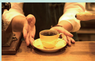
喫茶 ROSTRO (代々木八幡)