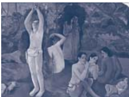
ポール・ゴーギャン 《我々はどこから来たのか 我々は何者か 我々はどこへ行くのか》(部分) ボストン美術館蔵 Tompkins Collection-Arthur Gordon Tompkins Fund, 36.270