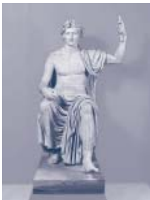
《アウグストゥス座像》 1世紀前半 大理石 高さ215cm ヘルクラネウム出土 ナポリ国立考古学博物館

人類史上最長・最大の繁栄を誘った古代ローマ帝国は、壮大な歴史的遺物や数多くのエピソードによって、今もなお私たちの心をとらえてやみません。