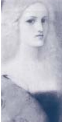
フェルナン・クノップフ 《ヴェネツィアの思い出》 1901年頃 パステル、鉛筆・紙 姫路市立美術館蔵

本展覧会は、姫路市立美術館が所蔵する、日本最大級の質と規模のベルギー美術コレクションから、19世紀末のフェルナン・クノップフ、ジャン・デルヴィル、ジェームズ・アンソールらから20世紀のポール・デルヴォー、ルネ・マグリットまでの油彩、素描、版画などにより構成され、まれにみる濃密な展開を示したベルギー近代美術のハイライトを紹介します。