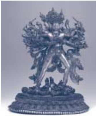
カラチャクラ父母仏立像(ふもぶつりゅうぞう) 銅造鍍金、トルコ石、珊瑚、彩色/チベット・14世紀前半 総高59.5cm シャル寺蔵

世界的に注目を集めているチベット文化を総合的に紹介する、わが国初の展覧会です。護法のため恐ろしい顔つきの仏や女性の仏、慈悲と智慧の合一を示す抱擁する仏など、日本に伝わった密教とは全く異なる、チベット密教美術の世界を紹介すると同時に、平均標高4,000mを超えるチベット高原で、密教文化を背景に培われた独特の暮らしの知恵であるチベット医学や装飾品、楽器など、チベット精神世界の神髄に触れていただける、貴重な機会といえます。