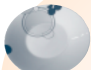
① 帝国ホテル お皿