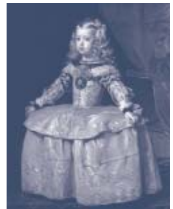
ディエゴ・ベラスケス《白衣の女王マルガリータ・テレサ》 1656年頃 油彩、カンヴァス ウィーン美術史美術館蔵

※10/10(土)、10/11(日)、10/12(月・祝)は高校生無料観覧日(学生証が必要)です