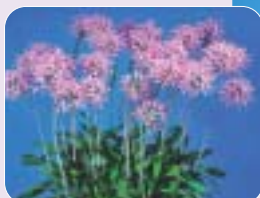
世界らん展日本大賞2009 ◀優秀賞