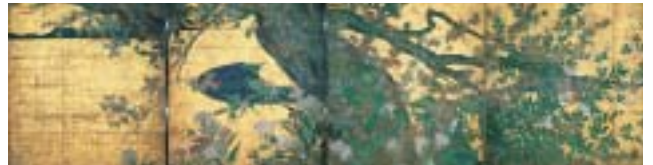
長谷川等伯 国宝 楓図壁貼付 京都・智積院蔵