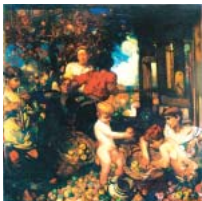
フランク・ブラングィン/《りんご搾り》/1902年/油彩・カンヴァス/ リス・ファイン・アート/ Photo: LISSFINEART.COM/©David Brangwyn