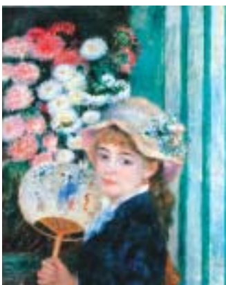
《団扇を持つ若い女》クラーク美術館 1879-80年頃 65.0×54.0cm

※中学生以下無料、障害者手帳をお持ちの方と付添いの方1名は無料 ※2/11(木・祝)、12(金)、13(土)は高校生無料観覧日(学生証提示が必要です)