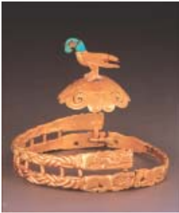
鷹形金冠飾り（戦国時代・金製） 内モンゴル博物院所蔵

チンギス・ハーンが1206年に建国したモンゴル帝国は、13世紀後半には世界最大の領土を支配しました。本展は、謎に包まれたチンギス・ハーンの生涯と世界最大のモンゴル帝国を紹介する本格的な展覧会です。装飾品、武具、衣類、生活用具、祭儀品など多岐にわたる展示品により、モンゴル騎馬遊牧民族の足跡を辿ります。