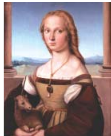
ラファエロ・サンツィオ 《一角獣を抱く貴婦人》 1506年頃 ボルゲーゼ美術館蔵

料金 一般 700円(当日1,400円) 学生 600円(当日1,200円) 高校生 350円(当日 700円) 65歳以上 400円(当日 800円) ※中学生以下無料、身体障害者手帳・愛の手帳・療育手帳・精神障害者保健福祉手帳・被爆者健康手帳をお持ちの方とその付添いの方(2名まで)は無料 ※毎月第3水曜日はシルバーデーとし、65歳以上の方は無料