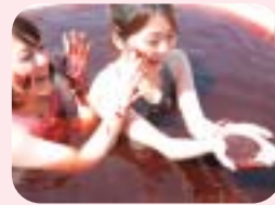
▲1月中旬~2月 チョコレート風呂