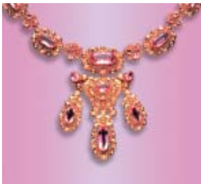
《ピンクパール&カラーゴールドネックレス》(スウィートの一部) 1830年頃 イギリス ゴールド、ピンクパール 種葉アンティークジュエリー美術館蔵

19世紀英国ヴィクトリア時代のジュエリーと当時の華やかな生活様式は、近代ヨーロッパの宝飾文化史において極めて重要な位置づけとなるだけでなく、今も多くの人を惹き付けるエレガントな魅力にあふれています。本展では英国王室にまつわる宝飾品や著名なコレクションをはじめとする、ヴィクトリア時代を中心とした技巧を凝らしたジュエリーの数々をご紹介します。