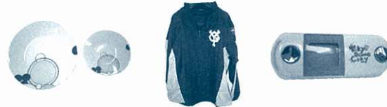
No.1 ノリタケ お皿セット

各企業様にご協賛いただいた商品を 会員のみなさまにプレゼントいたします。 たくさんのご応募お待ちしております。