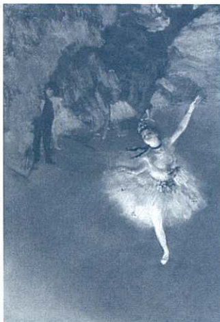
エドガー・ドガ 《エトワール》1876-77年 オルセー美術館

冷静さと機知をあわせ持ち、客観的な視点で近代都市パリの情景を描き残したエドガー・ドガ(1834-1917)。本展では、オルセー美術館所蔵のドガの名品45点に、国内外のコレクションから選りすぐった貴重な作品を加え、初期から晩年にわたる約120点を展覧いたします。また、ドガの描いた踊り子の作品の中でも傑作として名高い《エトワール》が初めて日本で公開されます。生涯を通じた新たな芸術の可能性に挑戦しつづけた画家ドガの、尽きぬ魅力を堪能できる展覧会です。