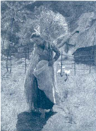
エミール・クラウス《刈草干し》 1896年 油彩・キャンヴァス 個人蔵

19世紀の後半、風景や農村の情景を主題とし、戸外で制作するという新しい志向を持った画家たちは、都市の喧騒を離れて自然の中へと移り住み、ヨーロッパ各地に芸術家村(コロニー)を生み出しました。ベルギーでは、アントワープに近いのどかな村に、フランダース各地の芸術家たちが移り住み、ベルギーのアートシーンにおいて、質の高い独自の芸術を展開させていきました。豊かな自然と共存しながら、フランダースの田園風景やそこに住む人々の姿を独自の視点で描き出すかれらの作品は、何よりもゆったりとした時間の流れによって観る者に心の安らぎを与えてくれることでしょう。