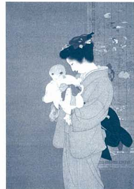
《母子》1934(昭和9年) 東京国立近代美術館蔵

休館日 月曜日(ただし、9/20、10/11は開館)、9/21(火)、10/12(火) 開館時間 10:00～17:00 (毎週金曜日は20:00まで) ※入館は閉館の30分前まで 料金 一般 650円(当日1,300円) 大学生 450円(当日900円) 高校生 200円(当日 400円) ※中学生以下、障がい者手帳をお持ちの方とその付添いの方1名は無料