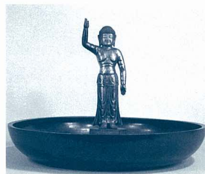
誕生釈迦仏立像及び灌仏盤 国宝 奈良時代・8世紀 東大寺蔵