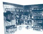
No.18 優勝記念図書カード