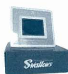
No.16デジタル フォトフレーム