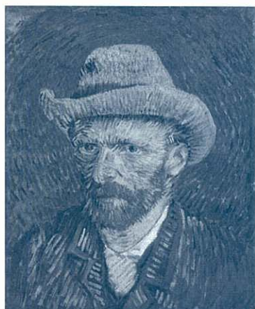
フィンセント・ファン・ゴッホ《灰色のフェルト帽の自画像》 1887年 ファン・ゴッホ美術館(フィンセント・ファン・ゴッホ財団)

2010(平成22)年は、フィンセント・ファン・ゴッホ(1853-1890)が没して120年目にあたります。本展は、ゴッホの代表作に加え、ゴッホに影響を与えた画家たちの作品、ゴッホ自身が集めたコレクションなどを展示し、「ゴッホがいかにして『ゴッホ』になったか」を明らかにするものです。