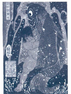
坂田怪童丸 〈前期展示〉