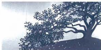
速水御舟 名樹散椿【重要文化財】1929(昭和4)年 紙本金地・彩色 山種美術館蔵(前期展示)

今回の特別展では、当館の代表的な作品から隠れた優品まで約80点をセレクトし、前期と後期で全点を入れ替えてご紹介いたします。普段はまとまって展示されることのない傑作の数々が一堂に会する本展覧会を通じて、山種コレクションの神髄を心ゆくまでご堪能ください。