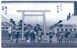
東海道四十四 五十三次 四日市(隸書版) 歌川広重 江戸時代 嘉永年間(1848～1854) サントリー美術館蔵

休館日 12月20日(火)、27日(火) 12月30日(金)～2012年1月1日(日) 開館時間 10:00～18:00 (金・土曜日、12月22日(木)は20:00まで) ※いずれも入館は閉館の30分前まで 料金 一般 650円(当日券 1,300円) 大学・高校生 500円(当日券 1,000円) ※中学生以下無料