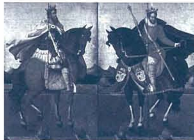
重要文化財 泰西王侯騎馬図屏風 左隻 四曲一双 桃山時代～江戸時代初期 17世紀初期 サントリー美術館蔵

料金 一般 650円(当日券 1,300円) 大学生・高校生 500円(当日券 1,000円) ※中学生以下無料