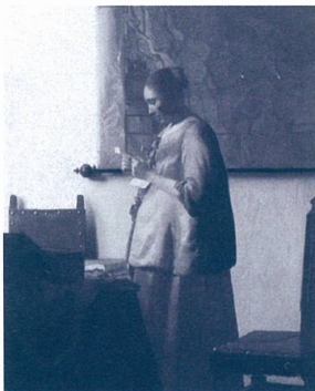
ヨハネス・フェルメール《手紙を読む青衣の女》 Johannes Vermeer "Girl Reading a Letter" 1663-64年頃 油彩・キャンヴァス アムステルダム国立美術館 ©Rijksmuseum, Amsterdam. On loan from the City of Amsterdam (A.van der Hoop Bequest)

本展は日本初公開となる《手紙を読む青衣の女》をはじめ、《手紙を書く女》、《手紙を書く女と召使》の3作品が一堂に会するまたとない機会です。さらに、同時代に描かれた、人々の絆をテーマにした秀作も併せて紹介し、人物のしぐさや表情、感情の動きに注目することで、17世紀オランダ社会における様々なコミュニケーションのあり方を展覧していきます。