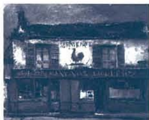
佐伯祐三 レストラン(オレヴェイユ・マタン) 1927(昭和2)年 カンヴァス・油彩 山種美術館蔵(後期展示)