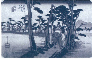
東海道五拾三次之内 吉原(保永堂版) 歌川広重 江戸時代 天保4年(1833)頃 那珂川町馬頭広重 美術館蔵

歌川広重の代表作である保永堂版「東海道五拾三次之内」と隸書版「東海道」を一挙に公開し、比較を行いながら江戸から京都までの道のりをたどります。保永堂版は、刊行当初の様子を伝える〈初摺〉や、一部の図様が改変された〈変わり図〉、55枚完結後に画帖として再発行された際の〈絵袋〉なども併せて展示し、人気商品であったこのシリーズが様々な展開していく様子を見ていきます。