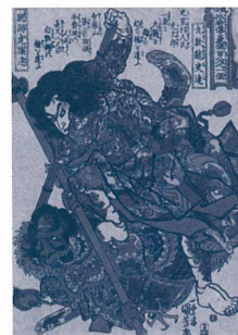
通俗水滸伝豪傑百八人之一個 九紋龍史進・跳淵虎陳達 〈前期展示〉

休館日 1月18日(水) 開館時間 10:00～20:00 (火曜日は17:00まで) ※いずれも最終入場は閉館の30分前まで 料金 一般 750円(当日券 1,500円) 高校・大学生 600円(当日券 1,200円) 4歳～中学生 250円(当日券 500円)