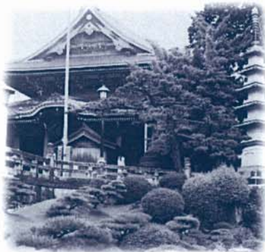
豊川稲荷「庭園から見た本殿」