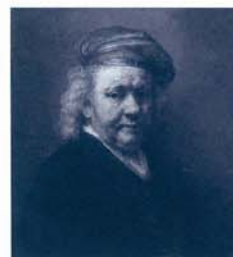
レンブラント・ファン・レイン 「自画像」1669年 マウリッツハイス美術館蔵