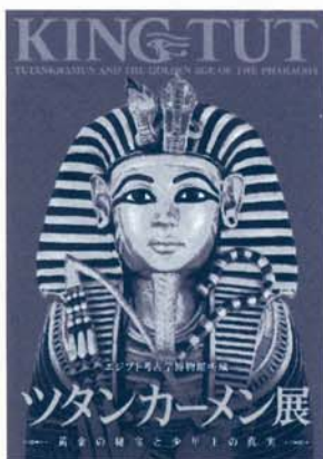
写真:黄金のカノポス(内蔵が保管されていた器)