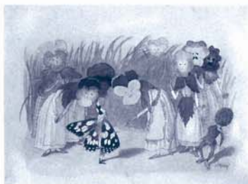
『花を積みか』より『まま母さん』 水彩、墨、紙 1926年以前ベルン美術館

子供のような無垢な眼差しと自由な想像力で、小さな生き物たちを主人公にした不思議な詩情あふれる文章とともに生み出した絵本画家エルンスト・クライドルフ(1863-1956)。スイスではいまでも子供たちに愛され読みつがれる国民的な絵本画家で、19世紀から20世紀初頭にかけてのヨーロッパにおける絵本の黎明期を代表する一人としても評価の高いアーティストです。本展は、ベルン美術館寄託の作品を中心に約200点でたどる日本で初めての大規模なクライドルフ回顧展です。