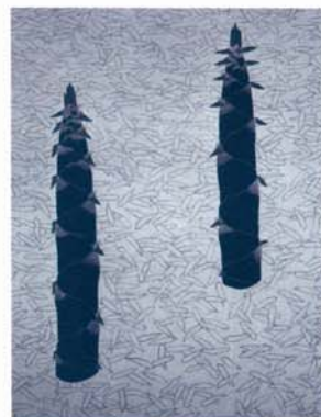
福田平八郎《筍》 1947(昭和22)年 絹本・彩色 山種美術館蔵