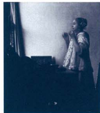
ヨハネス・フェルメール《真珠の首飾りの少女》 1662-65年 油彩、カンヴァス 絵画館

※心身に障がいのある方及び付添者1名は無料(入館の際に障がい者手帳等をご提示ください)。