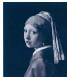
ヨハネス・フェルメール 「真珠の耳飾りの少女」1665年頃 マウリッツハイス美術館蔵

※毎月第3水曜日はシルバーデーとし、65歳以上の方は無料いずれも、証明 できるものをご持参ください。