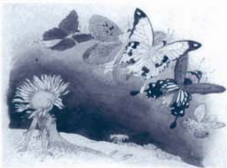
『花を棲みかに』より『わたりどり』 水彩・墨・紙 1926年以前 ヘルム美術館