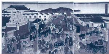
歌川芳虎「東京日本橋風景」 明治3年(1870) 江戸東京博物館蔵

本展は、400年以上の歴史を持つ日本橋の姿を、江戸から明治、大正、昭和に至るまでの浮世絵や版本、絵巻、そして近代版画や写真など、江戸東京博物館のコレクション約130件で紹介いたします。加えて、日本橋近くの版元から安永3年(1774)に出版された『解体新書』や、明治初期に橋のたもとで営業を開始し、全国へ広がった「人力車」なども展示。いつの時代も愛された日本橋の姿をどうぞお楽しみ下さい。