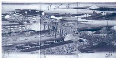
歌川広重「東都名所 日本橋真景并二魚市全図」 天保(1830～43)中頃 江戸東京博物館蔵