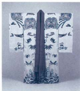
国宝 黄色地鳳凰編織宝尽くし青海波立波模様の衣裳 18-19世紀 那覇市歴史博物館蔵