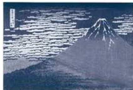
葛飾北斎「富士三十六景 凱風快晴」大判錦絵 ベルリン国立アジア美術館蔵