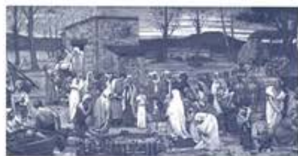
ピエール・ビュヴィス・ド・シャヴァンヌ 《聖ジュヌヴィエーヴの幼少期》 1875年頃 油彩・カンヴァス 島根県立美術館蔵