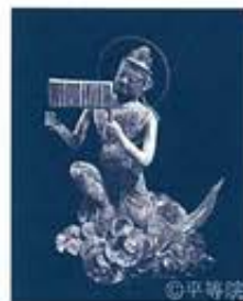
国宝 雲中供養菩薩像 南1 平安時代 天喜元年(1053) 京都・平等院蔵

料金 一般 650円(当日券1,300円) 大学・高校生 500円(当日券1,000円) ※中学生以下無料