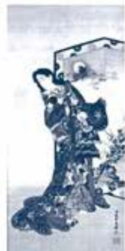
地獄太夫 河崎朝彦画 明治時代・19世紀 クリーブランド美術館蔵