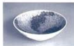
色絵収重ね草花文鉢 今泉今右衛門(十三代)作 平成8年(1996) 東京国立博物館蔵