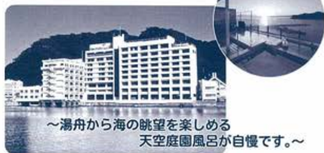
～湯舟から海の眺望を楽しめる 天空庭園風呂が自慢です。～