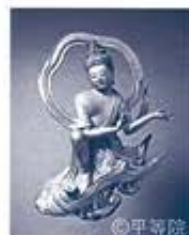
国宝 阿彌陀如来坐像光背飛天 南4 平安時代 天喜元年(1053) 京都・平等院蔵

空を飛び、舞い踊る天人は「飛天」と呼ばれ、インドで誕生して以来、優美で華麗な姿で人々を魅了し続けてきました。本展覧会では、地域・時代を超えて展開した飛天の姿を、彫刻・絵画・工芸の作品によってたどります。京都・平等院鳳凰堂の修理落慶に先立ち、堂内の国宝《雲中供養菩薩像》、さらに国宝《阿彌陀如来坐像光背飛天》を寺外初公開します。屈指の名品を間近に鑑賞できるたいへん貴重な機会をお見逃しなく。