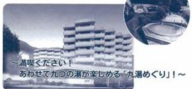
～満喫ください！ あわせて九つの湯が楽しめる「九湯めぐり」！～