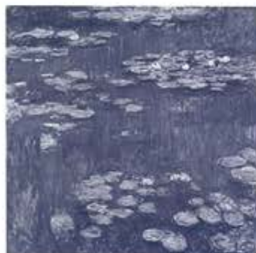
クロード・モネ《睡蓮》1916年 油彩/カンヴァス 200.5×201cm 国立西洋美術館 松方コレクション

※心身に障がいのある方とその付添者1名は無料(入館の際に障がい者手帳をご提示ください)