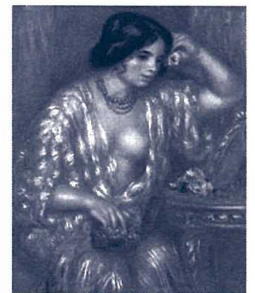
ピエール=オーギュスト・ルノワール 《宝石をつけたガブリエル》 1908-10年頃 油彩・キャンヴァス

モネ、ルノワール、セザンヌ、シャガール…フランス近代美術の巨匠たちの作品が一堂に。繁栄を謳歌していた頃の夢見るフランス絵画の世界をお楽しみください。