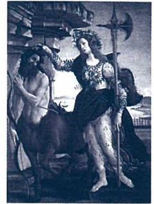
サンドロ・ポッティチェリ 《パラスとケンタウロス》 1480-85年 テンペラ、カンヴァス ウフィツィ美術館

本展は、世界的に名高いウフィツィ美術館の収蔵品を通して、15世紀から16世紀にかけてのフィレンツェ美術を牽引した主要な画家たちの約80点に及ぶ作品や、《パラスとケンタウロス》をはじめとするポッティチェリ作品を多数紹介します。