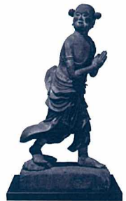
国宝 善財童子立像 鎌倉時代・建仁3年(1203)~承久2年(1220) 奈良・安倍文殊院蔵

14年ぶり3回目となる東京国立博物館の「日本国宝展」。時空を超えて、約120件の国宝が集結します。祈りをテーマに、仏と神と、人の心をつなぐ役割を担ってきた絵画・彫刻・工芸・典籍・考古資料など、日本文化の粋の結集をご覧ください。