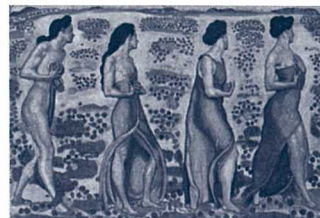
《感情Ⅲ》 1905年、油彩・カンヴァス、117.5×170.5cm、ベルン州

料金 一般 800円(1,600円) 大学生 600円(1,200円) 高校生 400円(800円) (当日料金)