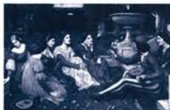
ジョン・ウィリアム・ウォーターハウス《ダカメロン》1916年 油彩・カンヴァス