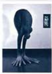
松岡 圭介 (a tree man) 2011年 写真展共：アートシード