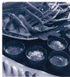
(ウィークエンドランチbuffetイメージ)