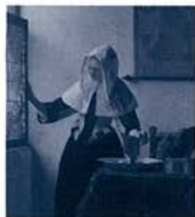
ヨハネス・フェルメール 《水差しを持つ女》 1662年頃 油彩・カンヴァス、45.7×40.8 cm メトロポリタン美術館、ニューヨーク Marquand Collection, Gift of Henry G. Marquand, 1895(SM.15.21)

※1/26(火)、2/2(火)・9(火)・16(火)・ 23(火)は17:00までの開館 ※入館は閉館の30分前まで