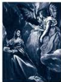
エル・グレコ 《受胎告知》 1590年頃-1603年 油彩、 カンヴァス 109.1x80.2cm