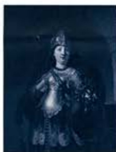
レンブラント・ファン・レイン 《イペローナ》 1639年 油彩・カンヴァス、127.0×97.5 cm メトロポリタン美術館、ニューヨーク The Friedman Collection, Bequest of Michael Friedman, 1931(O2.100.23)

料金 ▶ 一般 800円(1,600円) (当日料金) 高校・大学生 650円(1,300円) 4歳~中学生 300円(600円)