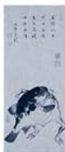
伊藤若冲 《河豚と蛙の相撲図》 18世紀(江戸時代) 紙本・墨画

料金 ▶ 一般 600円(1,200円) (当日料金) 高校・大学生 450円(900円)