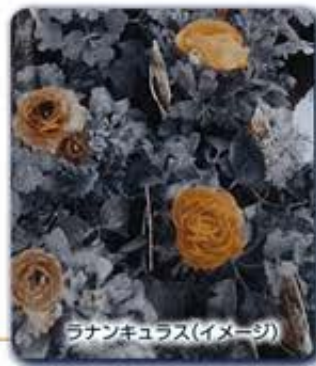
ランキュラス(イメージ)

150名様にランキュラス または サネリア の鉢植え(5号鉢)をプレゼント! どちらが届くかはお楽しみに!!