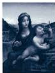
レオナルド・ダ・ヴィンチ 《処女と聖母子》1501年頃、 パウル・リピン・ヘリテージ・トラスト ©The Buccleugh Living Heritage Trust

※未就学児童無料。 ※身体障害者手帳・愛の手帳・療育手帳・精神障害者保健福祉手帳・被爆者健康手帳をお持ちの方とその付添いの方(2名まで) は無料。(入場の際到手帳等を提示) ※常設展は別途観覧料が必要です。