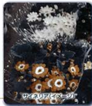
サネリア(イメージ)