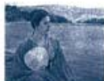
黒田清輝「湖畔」1877年(明治10) カンパス、油彩 東京国立博物館蔵