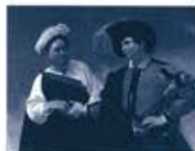
カラヴァッジョ「少年いっしょ」1617年頃、 油彩/カンパス、ローマ、カピトリウム美術館蔵