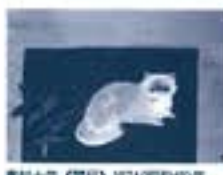
奥村土牛「牛」(1974)100x80cm 紙本・彩色 東京国立近代美術館蔵 (4/19-5/22展示)