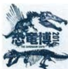
上/Courtesy of The University of Chicago 下/Courtesy of The Royal Saskatchewan Museum