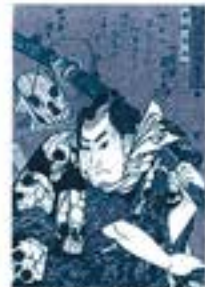
William Sturges Bigelow 「国芳もやう王札判頭金吾野村権助」 弘化2(1845)年頃 William Sturges Bigelow Collection, 11,28900