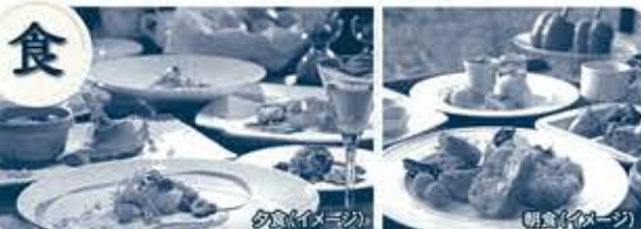
夕食は地元食材をふんだんに使った洋食コース料理。朝食はビュッフェを満喫。