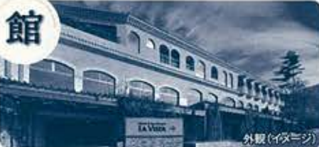
のんびりと貴賓をあじわう、リゾートライフ