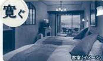
プロヴァンス調のお部屋でリラックス