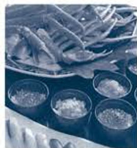
(ウイークエンドランチbuffetイメージ)