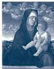
ジョヴァンニ・ベッリーニ 《聖母子(赤い髪天使の聖母)》 油彩/板 アカデミア美術館