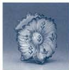
花器「フランス菊」 エミール・ガレ 1881-85年頃 サントリー美術館 (野依利之コレクション)