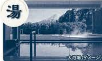
大パノラマで絶景を楽しむ天然温泉