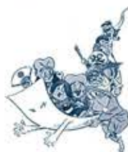
「鬼太郎と仲間たち」