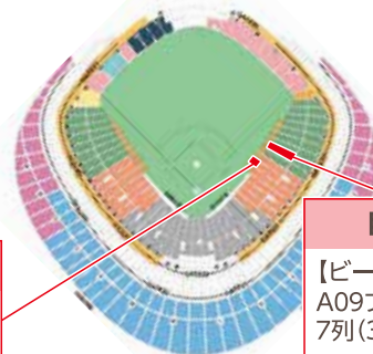
東京ドーム座席案内図