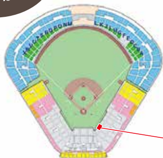
神宮球場座席案内図