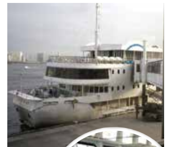
▲東京湾グルメツアー