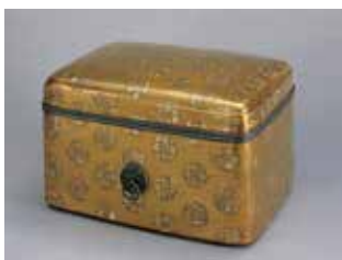
国宝《浮線綾螺鈿蒔絵手箱》 一合 鎌倉時代 13世紀 サントリー美術館