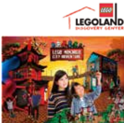
LEGO® is a registered trademark of the LEGO Group. © 2017 LEGO Group. All rights reserved.

300万個を超えるレゴ®ブロックが いっぱいの屋内型アトラクションです。 4月1日に新アトラクション『レゴ® ニンジャゴー シティ アドベンチャー』 がオープン!大人気シリーズ『レゴ® ニンジャゴー』の世界をテーマに、そ れぞれのキャラクターに合わせたアト ラクションでトレーニングをし、最強 の忍者を目指します!