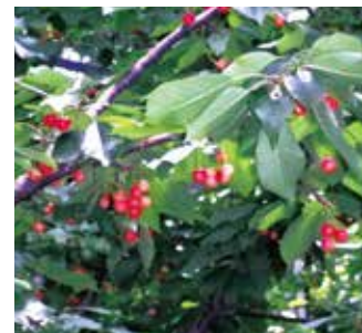
▲宿泊バスツアー・さくらんぼ