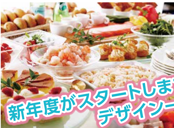
▲夏季・冬季グルメ食事券