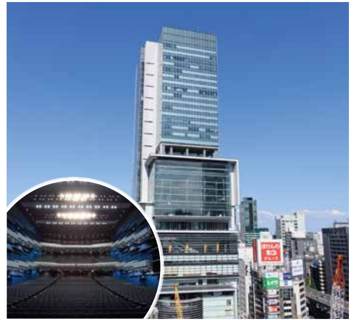
▲東急シアターオーブ