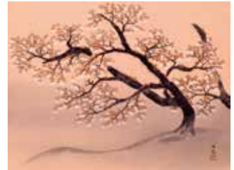
横山大観《山桜》 1934(昭和9)年 絹本・彩色 山種美術館