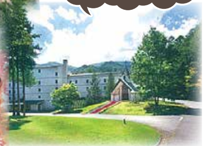
▲穂高ビューホテル