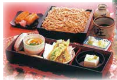
▲1日目昼食イメージ