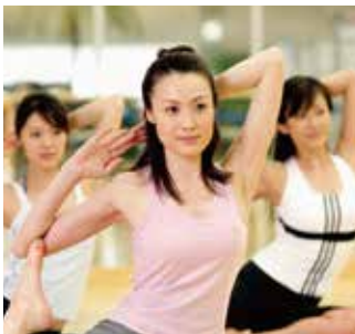
▲スポーツジムのチケットあつ旋