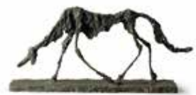
《犬》1951年 ブロンズ マルグリット&エメ・マープ財団美術館、 サン=ポール=ド=ヴァンス