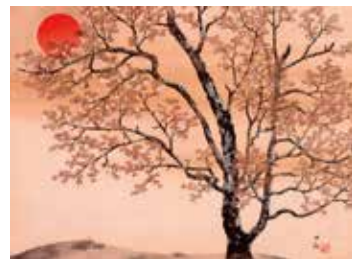
横山大観《春朝》1939(昭和14)年頃 絹本・彩色 山種美術館