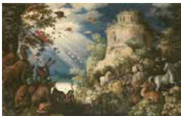
ルーラント・サーフェリー 《動物に音楽を奏でるオルフェウス》 1625年、油彩・キャンヴァス、プラハ国立美術館、チェコ共和国 The National Gallery in Prague