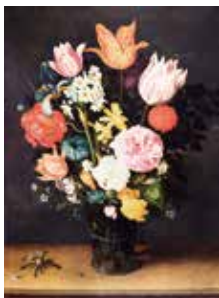
ヤン・ブリューゲル1世、 ヤン・ブリューゲル2世 《机上の花瓶に入った チューリップと薔薇》 1615-1620年頃 Private Collection