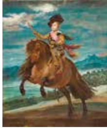
ディエゴ・ベラスケス 《王子バルタサール・カルロス騎馬像》 1635年頃 マドリッド、プラド美術館蔵