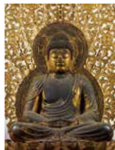
国宝「阿彌陀如来坐像」 平安時代・仁和4年(888) 京都・仁和寺蔵