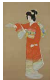
上村松園 《序の舞》(重要文化財) 昭和11年(1936) 東京芸術大学蔵