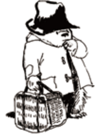
Illustrated by Peggy Fortnum © Paddington and Company Ltd 2018

一般 700円 (1,400円) 大学・高校生 450円 (900円) 中・小学生 300円 (600円) 親子券 750円 (1,500円)