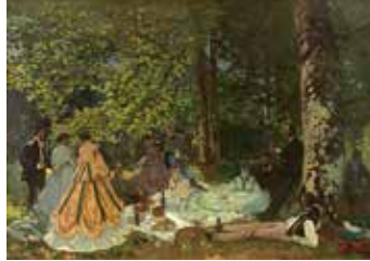
クロード・モネ《草上の昼食》1866年

一般 800円 (1,600円) 大学・専門学校生 650円 (1,300円) 高校生 400円 (800円) 65歳以上 500円 (1,000円) ※中学生以下無料