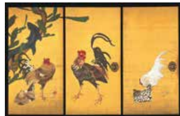
重要文化財 仙人群鶏図襖(部分) 伊藤若冲筆 大阪・西福寺蔵