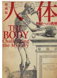
アンドレアス・ヴェサリウス 『ファブリカ』ファクシミリ版 (1964年)より