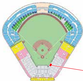
神宮球場座席案内図