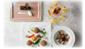
ディナー(イメージ)