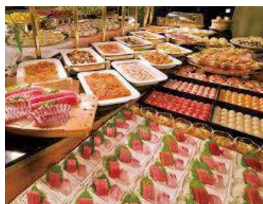
三崎マグロが食べ放題