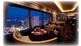
「ベイ・ビュー」店内(イメージ)