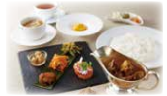
ランチ・カレーコース(イメージ)