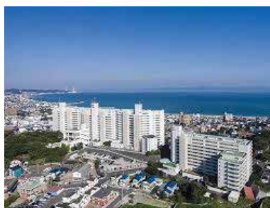
東京湾と房総半島を望む本館客室