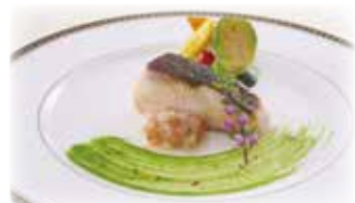
ランチメイン(イメージ)