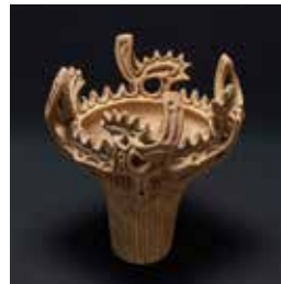
国宝 火焔型土器 新潟県十日町市 笹山遺跡出土 新潟・十日町市蔵(十日町市博物館保管)