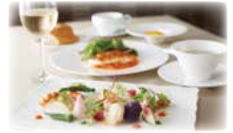
ランチ・洋食コース(イメージ)