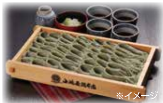
魚沼手繰りそばセット そば180g×5袋/つゆ70ml×5袋

「へぎそば」として知られる小嶋屋総本店は過去には皇室献上もされている地元の有名店です。フノリという海藻をそばのつなぎに使い、選び抜かれた地元魚沼産素材だけで仕上げた乾麺です。喉越し、歯ごたえはより生そばに近い食感を実現しております。