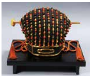
国宝 琉球国王尚家関係資料 玉冠(付替) 18~19世紀 那覇市歴史博物館 [展示期間:8/22~9/2]