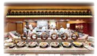
「コンパス」店内(イメージ)