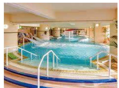
クアパーク完備(宿泊者割引)

◎交通手段:東京(品川)から、京急線(快特)で約65分。三浦海岸駅下車徒歩5分(駅から送迎バスもあり) 東京方面から首都高速経由で横浜横須賀道路へ 佐原ICより約20分(ホテル駐車場有料) ☆コンドミニウムタイプの広い客室、天然温泉大浴場完備、三崎マグロと三浦野菜の創作料理でおもてなし。