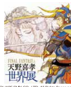
FINAL FANTASY ©1987 SQUARE ENIX CO., LTD. All Rights Reserved. IMAGE ILLUSTRATION : ©1987 YOSHITAKA AMANO