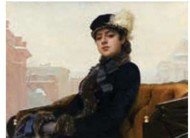
イワン・クラムスコイ 《忘れえぬ女(ひと)》 1883年 油彩・キャンバス