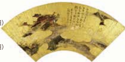
扇面画 帖一帖 室町~桃山時代 15~16世紀 奈良国立博物館