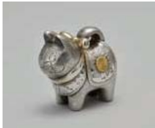
《大張子形ボンニエール》1933(昭和8)年 銀 皇太子(天皇陛下) 御誕生 御内宴