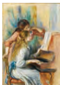
オーギュスト・ルノワール 《ピアノを弾く少女たち》 1892年頃、油彩・カンヴァス、116×81cm

※小学生以下無料 ※障がい者手帳をお持ちの方とその介護の 方(1名)は無料。 詳細は公式HPをご参照ください。