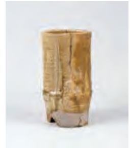
黄瀬戸竹花入 荒川豊蔵 昭和33年(1958) 愛知県陶磁美術館 (川崎晋三氏寄贈)

※中学生以下無料 ※障がい者手帳をお持ちの方は、ご本人 と介護の方1名様のみ無料。