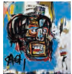
ジャン=ミシェル・バスキア Untitled, 1982 Yusaku Maezawa Collection, Chiba Artwork © Estate of Jean-Michel Basquiat. Licensed by Artestar, New York

※来場者全員に音声ガイドを無料提供 ※会場内混雑の際、入館までお待ちいた だく場合あり。 ※作品保護のため会場入口にて手荷物 検査を実施。