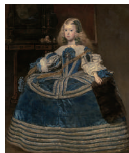
ディエゴ・ベラスケス《青いドレスの王女マルガリータ》 1659年 油彩/カンヴァス ウィーン美術史美術館 Kunsthistorisches Museum Wien