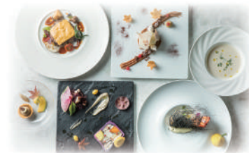
フランセーズ ディナー