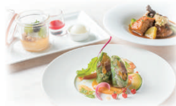
コンポジション ランチ