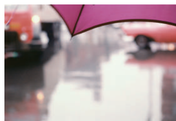
ソール・ライター 《薄紅色の傘》1950年代、発色現像方式印画